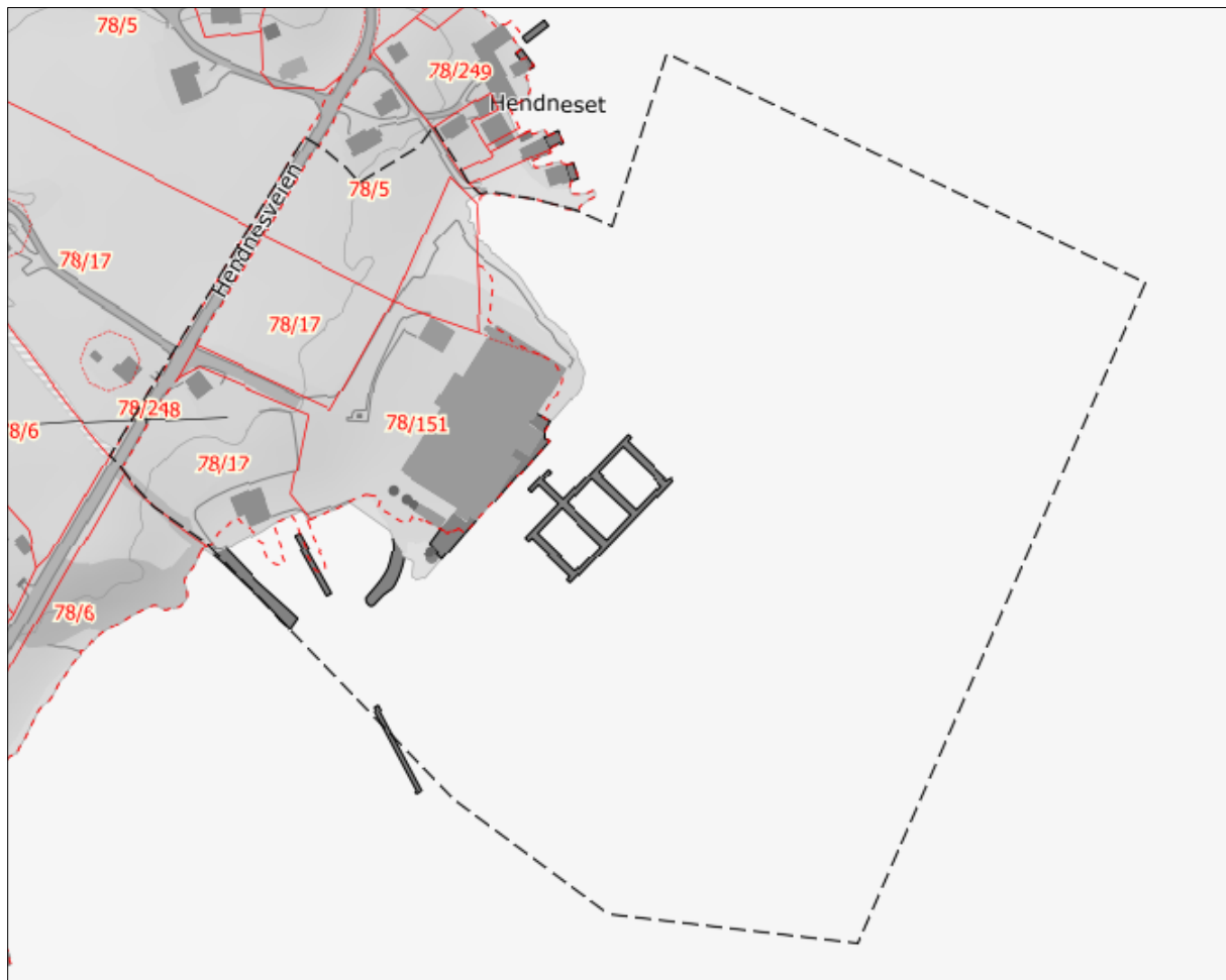
Forslag til plangrense

Planområdet er i dag preget av den eksisterende næringsbebyggelsen. Bygningsmassen er plassert på fylling i sjø. Mot sør er det etablert et anlegg for småbåter, mens de nærmeste områdene mot vest og nord er frittliggende småhusbebyggelse og landbruksjord. Et stykke nord for planområdet på selve Hendneset ligger det næringsbebyggelse.