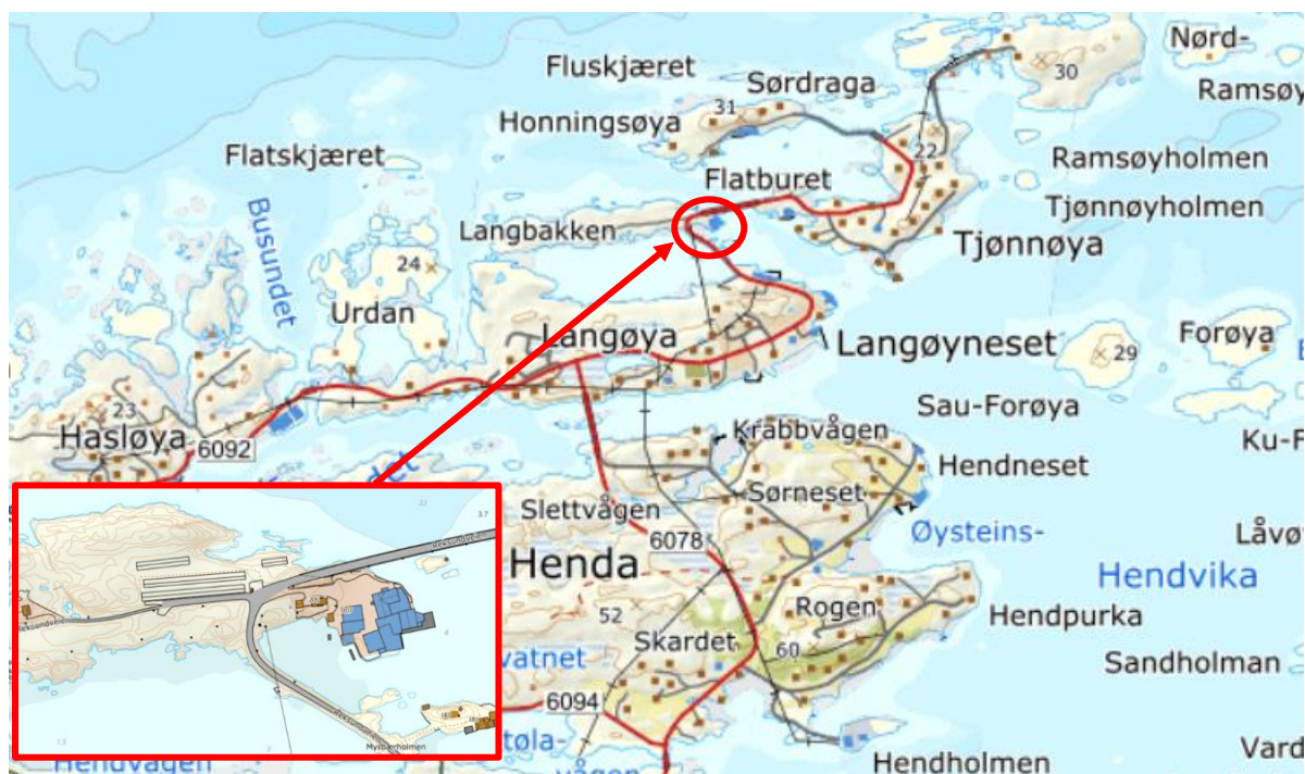
Figur 1: Planområdets lokalisering