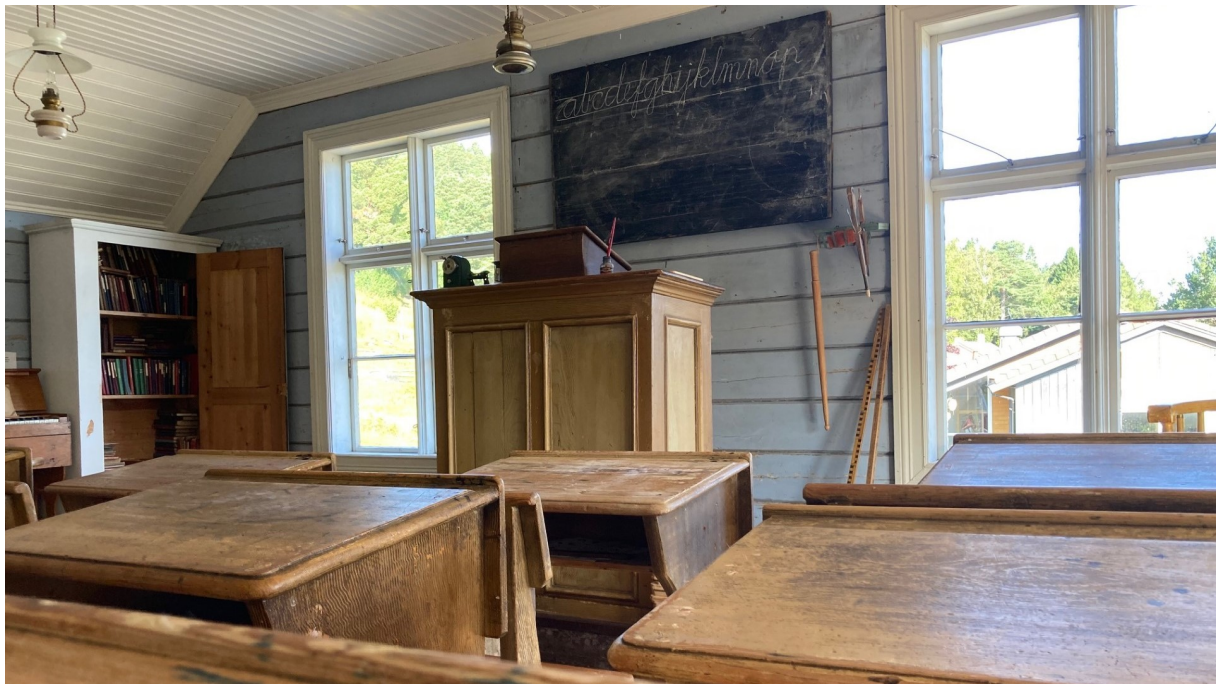
Nordmørsmusea AS, her bilde fra skolemuseet ved Gamle Kvernes bygdemuseum

styret. Aksjeloven regulerer ansatte sin representasjon i styret. AS fører regnskap etter regnskapsloven, og utarbeider årsmelding og årsberetning i henhold til bestemmelsene i denne.