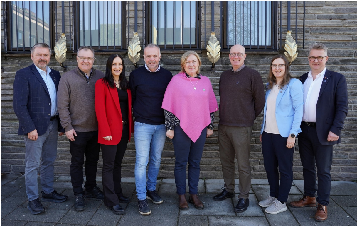
Nordmøre interkommunale politiske råd 2024 (NIPR)

Etter den nye kommunelovens kapitel 18 kan to eller flere kommuner eller fylkeskommuner kan sammen opprette et interkommunalt politisk råd. Rådet kan behandle saker som går på tvers av kommune- eller fylkesgrensene. Et interkommunalt politisk råd kan ikke gis myndighet til å treffe enkeltvedtak. Rådet kan likevel gis myndighet til å treffe slike vedtak om interne forhold i samarbeidet og til å forvalte tilskudsordninger.