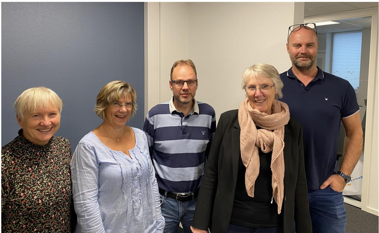
Bilde: Gericafaggruppe i IKT-ORKide

Vertskommunesamarbeid med felles folkevalgt nemd innebærer at kommunene oppretter en felles nemd hos vertskommunen med minimum 2 deltakere fra hver kommune. Deltakerkommunene kan delegere til nemnda myndighet til å treffe vedtak også i saker av prinsipiell betydning. Dette skal skje ved at kommunestyrene selv delegerer samme kompetanse til nemnda. Nemnda kan delegere til vertskommunens administrasjon myndighet til å treffe vedtak i enkeltsaker eller typer av saker som ikke er av prinsipiell betydning.