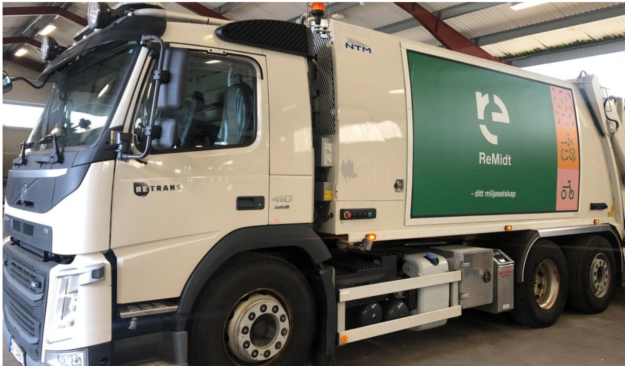
ReMidt IKS er det nye renovasjonsselskapet for Averøy kommune

styret og omgjøre beslutninger. Overfor tredjepart kan denne muligheten begrenses av at et utvidet myndighetsområde for representantskapet ikke er allment kjent.