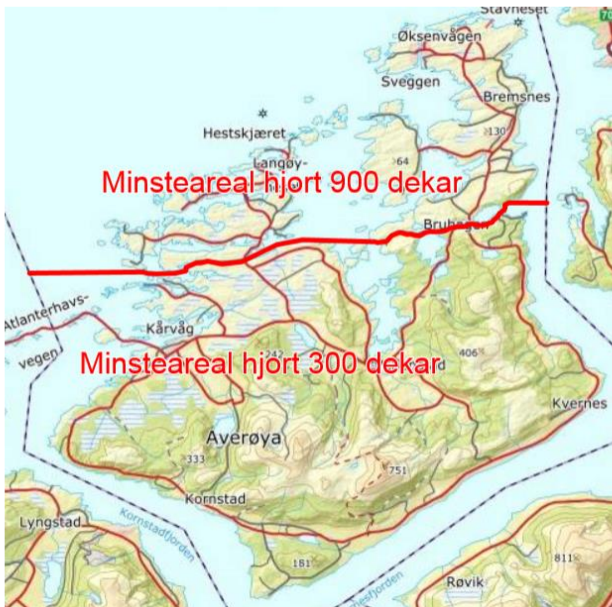
Figur 3. Kart som viser forslag til grensen mellom minstearealet på 900 og 300 dekar for hjort i Averøya kommune. Skillet mellom de to områdene med ulikt minsteareal går i en linje øst/vest gjennom kommunen langs følgende kommuneveier: KV4206 Kristvikveien, KV4205 Strømsvågveien, KV4204 Hjelsetveien og KV1409 Hasløyseterveien.

Ved å bruke regelen om et fravik fra minstearealet på 300 dekar med +/- 50% gir det en ramme på tildeling på mellom 288 og 864 fellingstillatelser. Dette vurderes å være en tilstrekkelig ramme for de neste 3 årene.